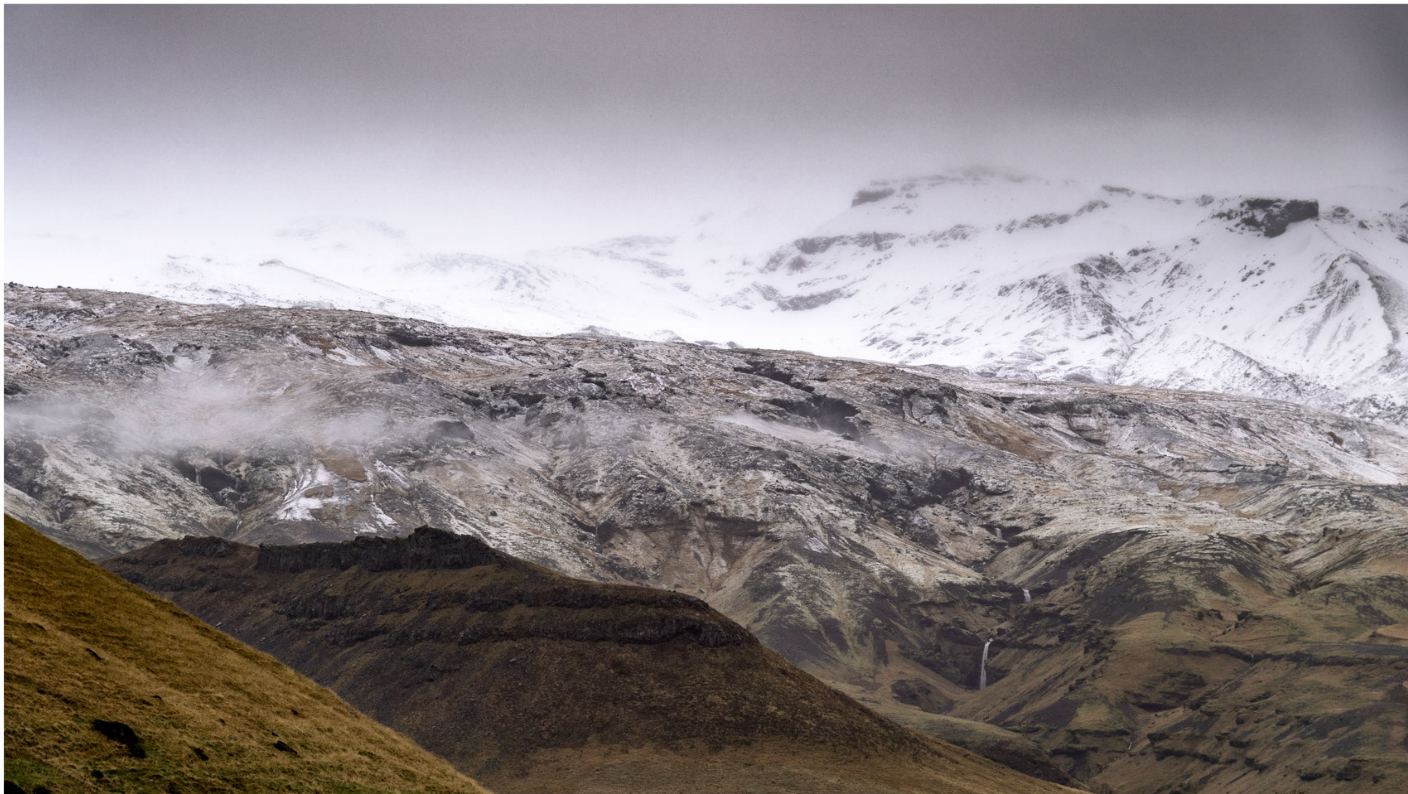
An den Abhängen des Eyjafjallajökull