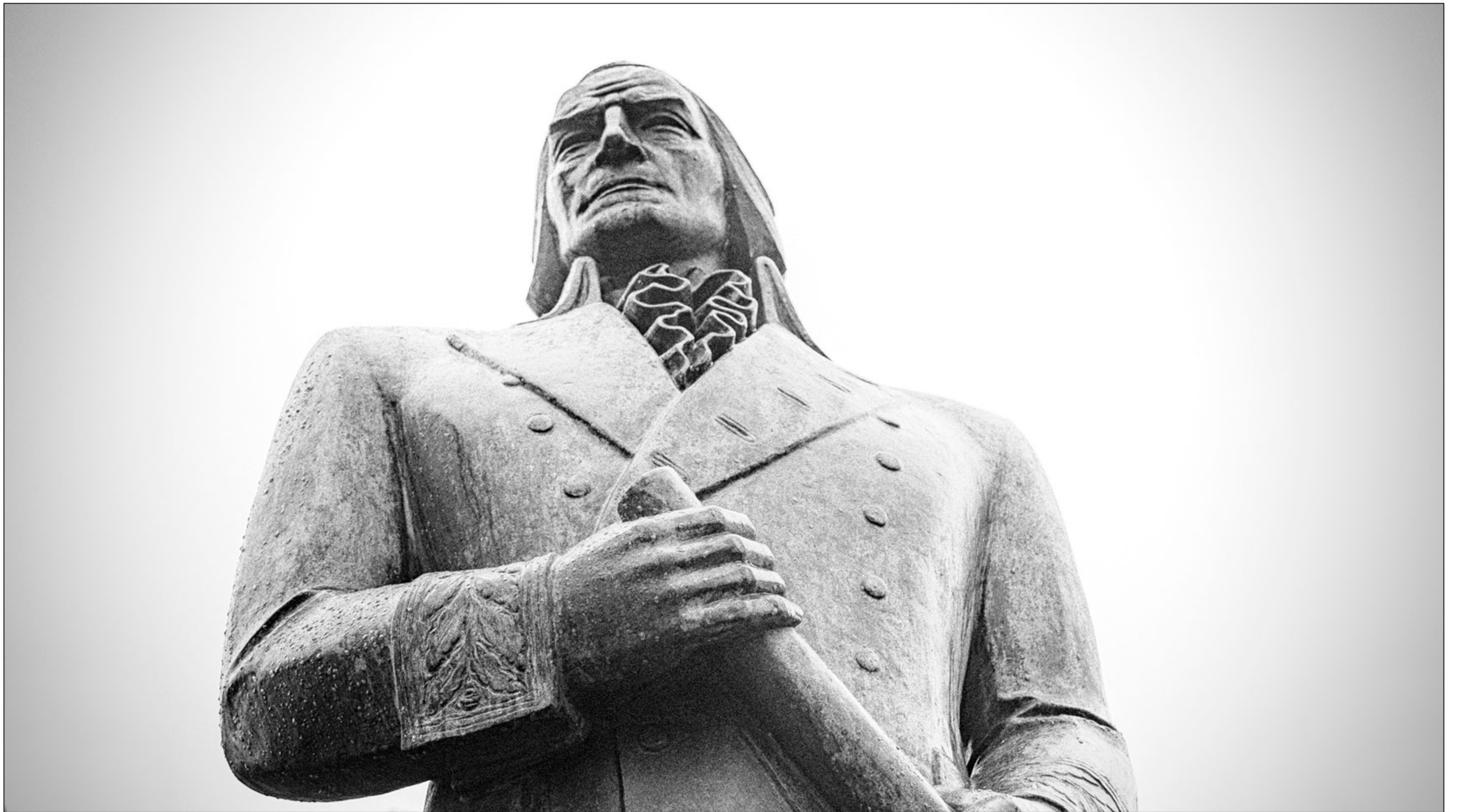
Skúli Magnússon, der „Vater von Reykjavik“