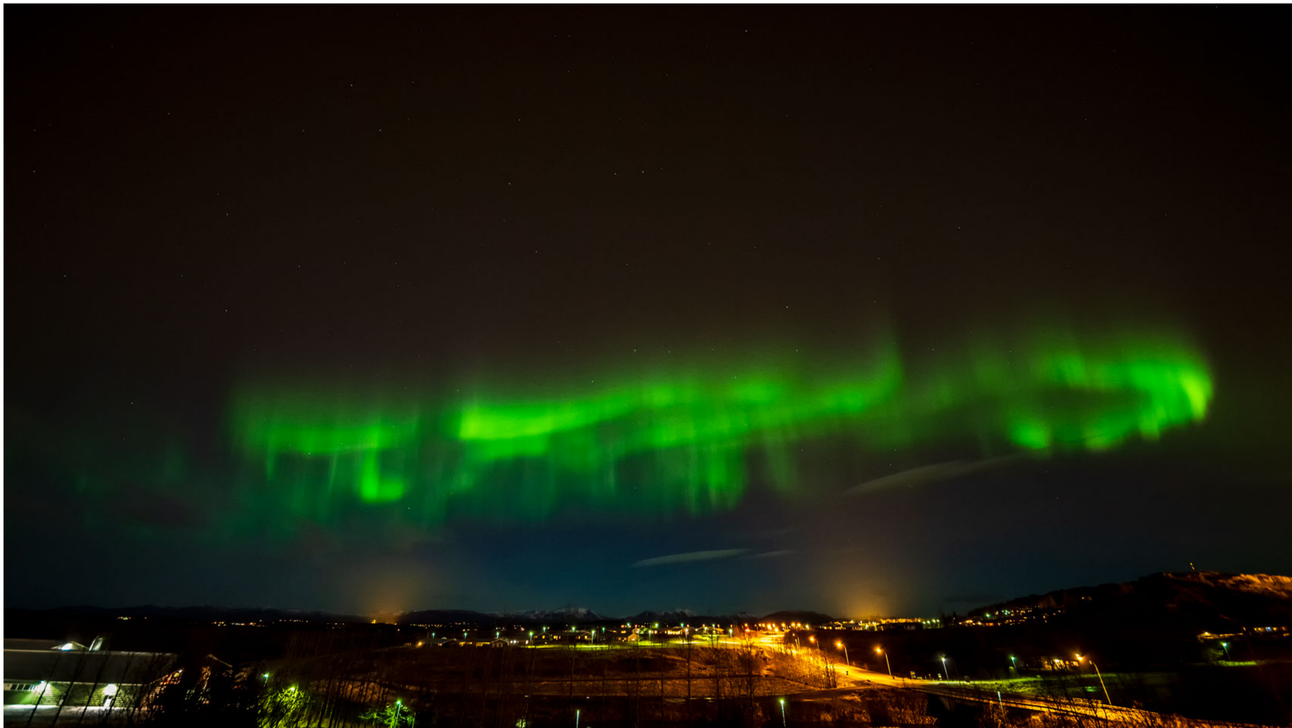
Aurora borealis in Fluðir