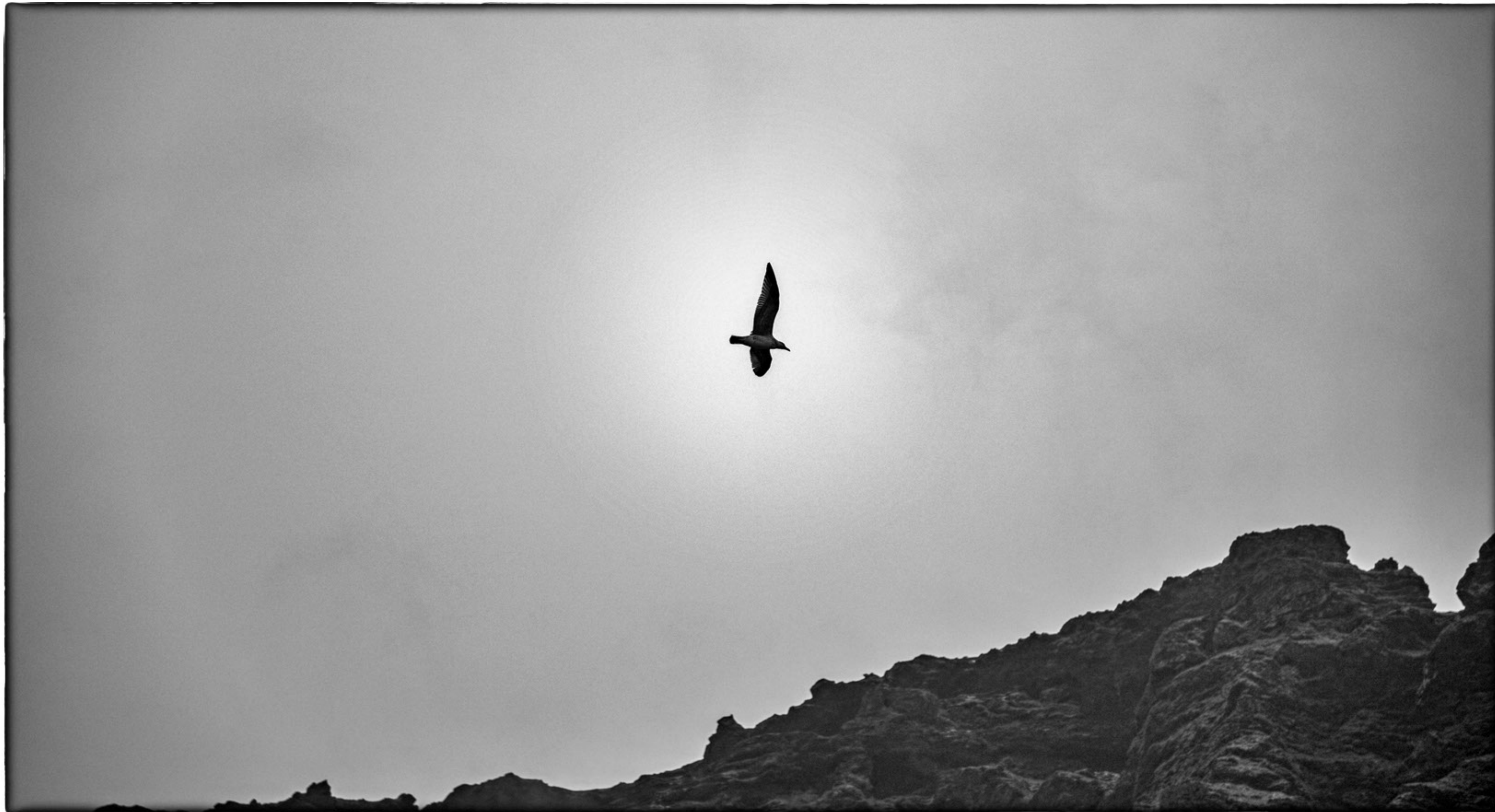
An der Südküste