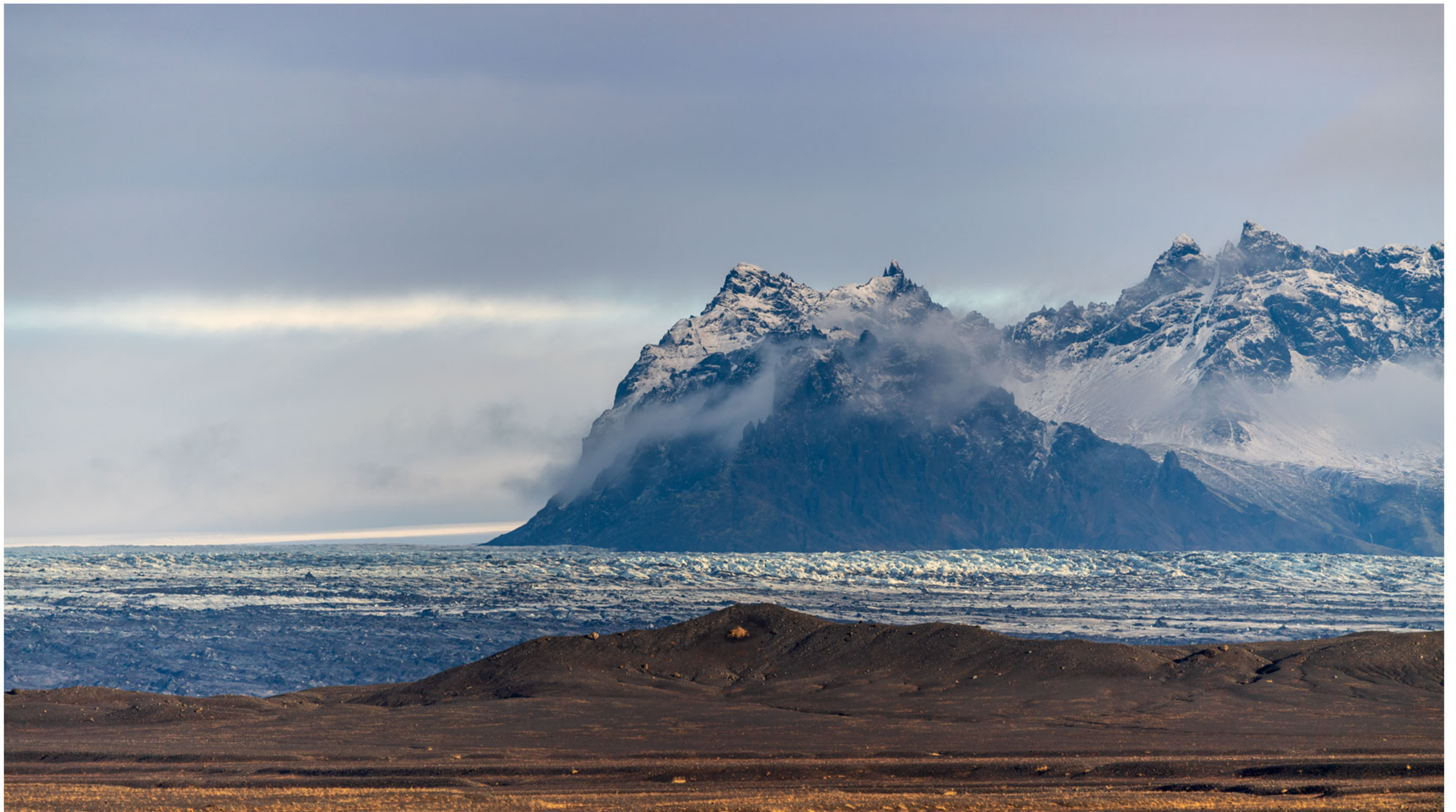
Die Gletscherzunge des Skeiðarárjökull