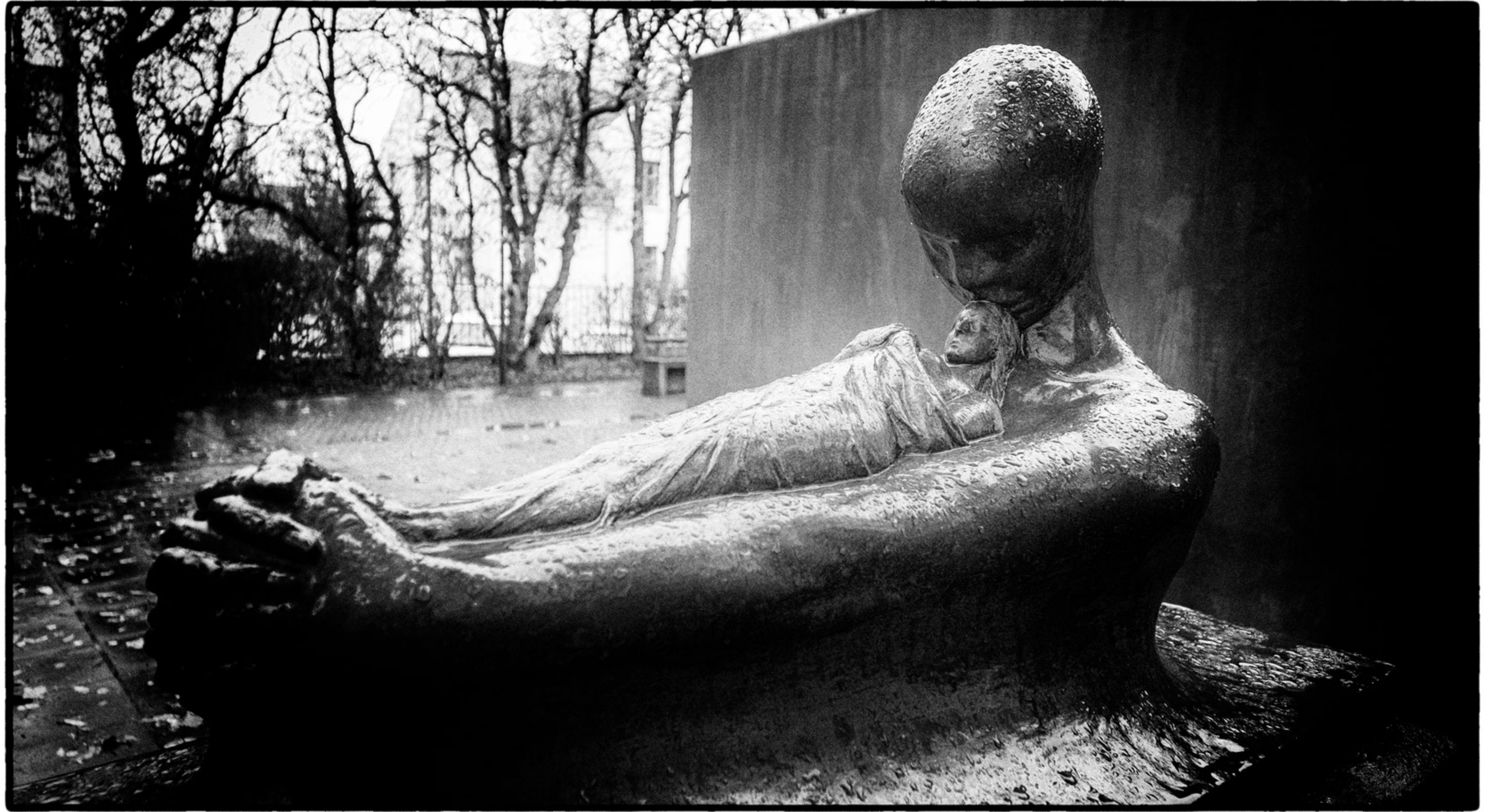
Skulpturenpark Einar Jónsson