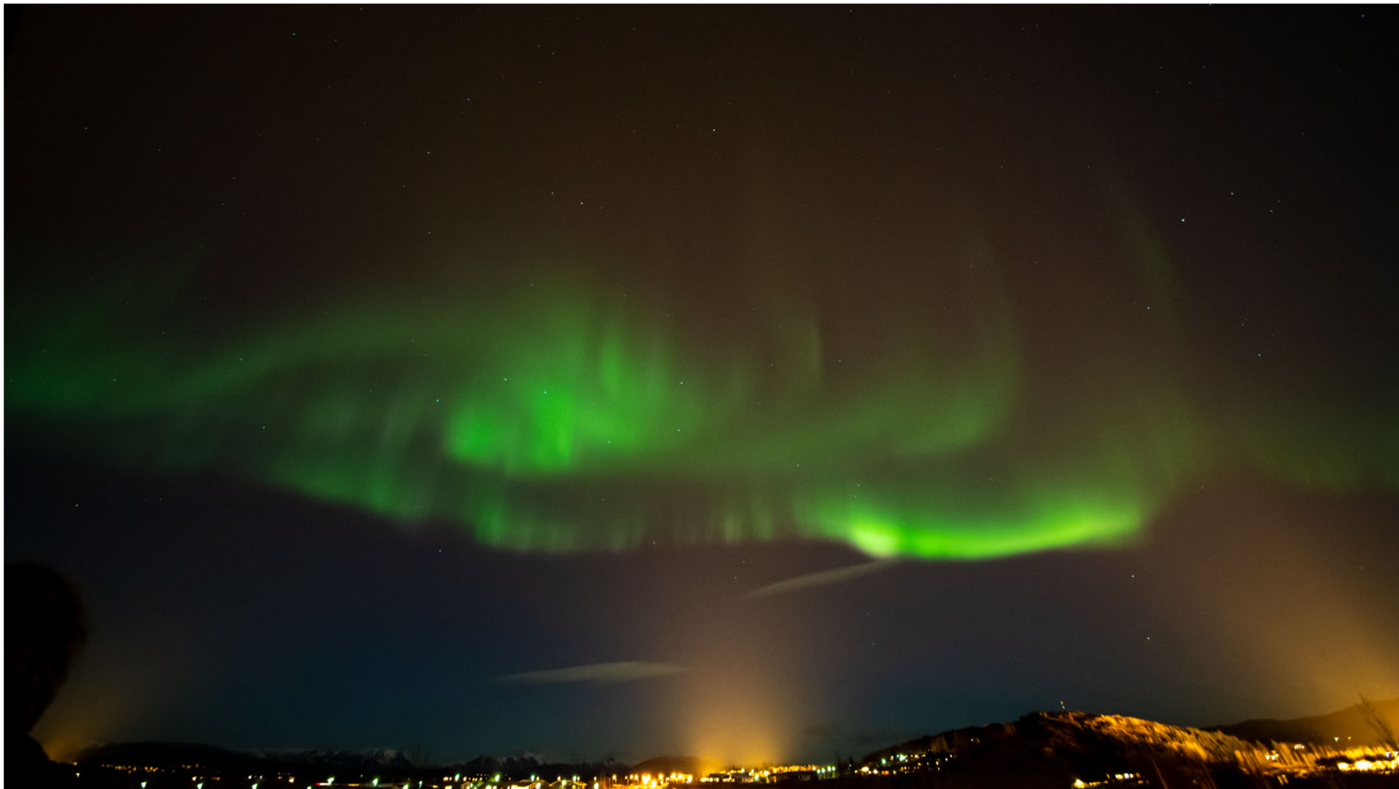
Aurora borealis in Fluðir