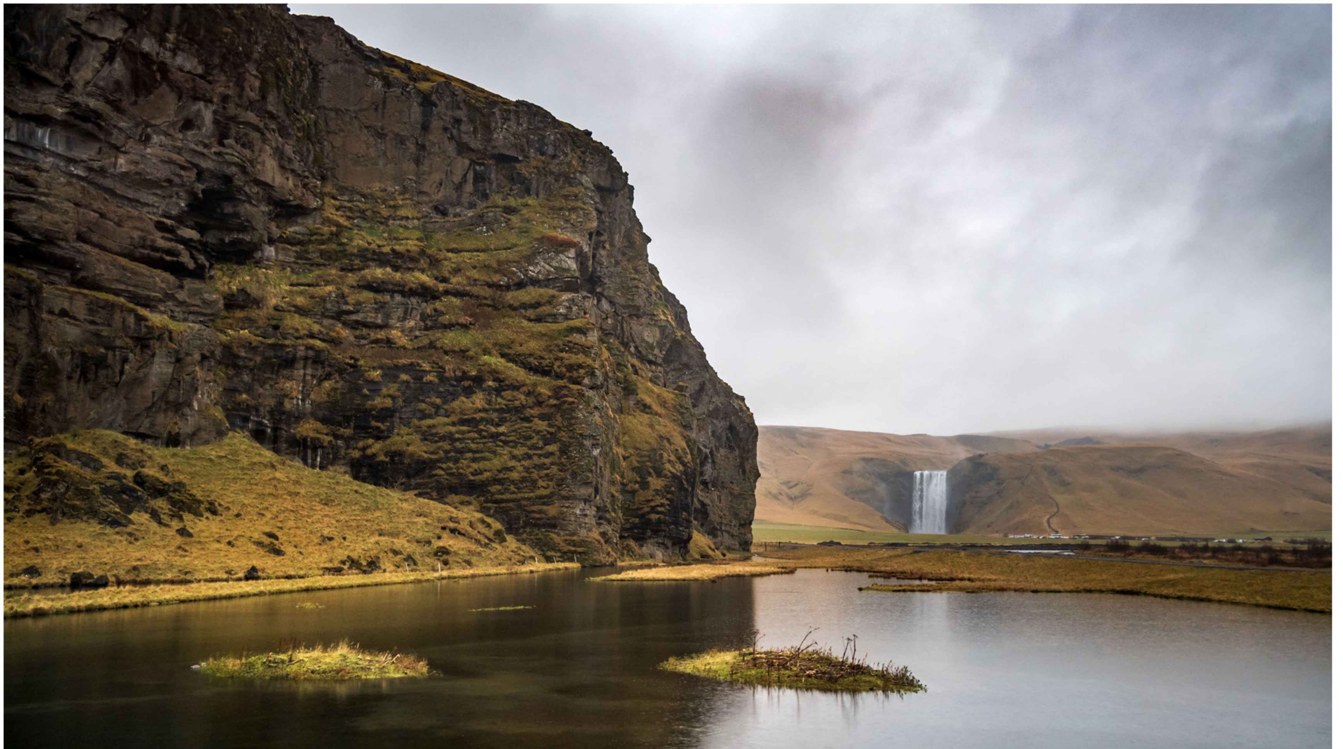
Blick auf den Skógafoss