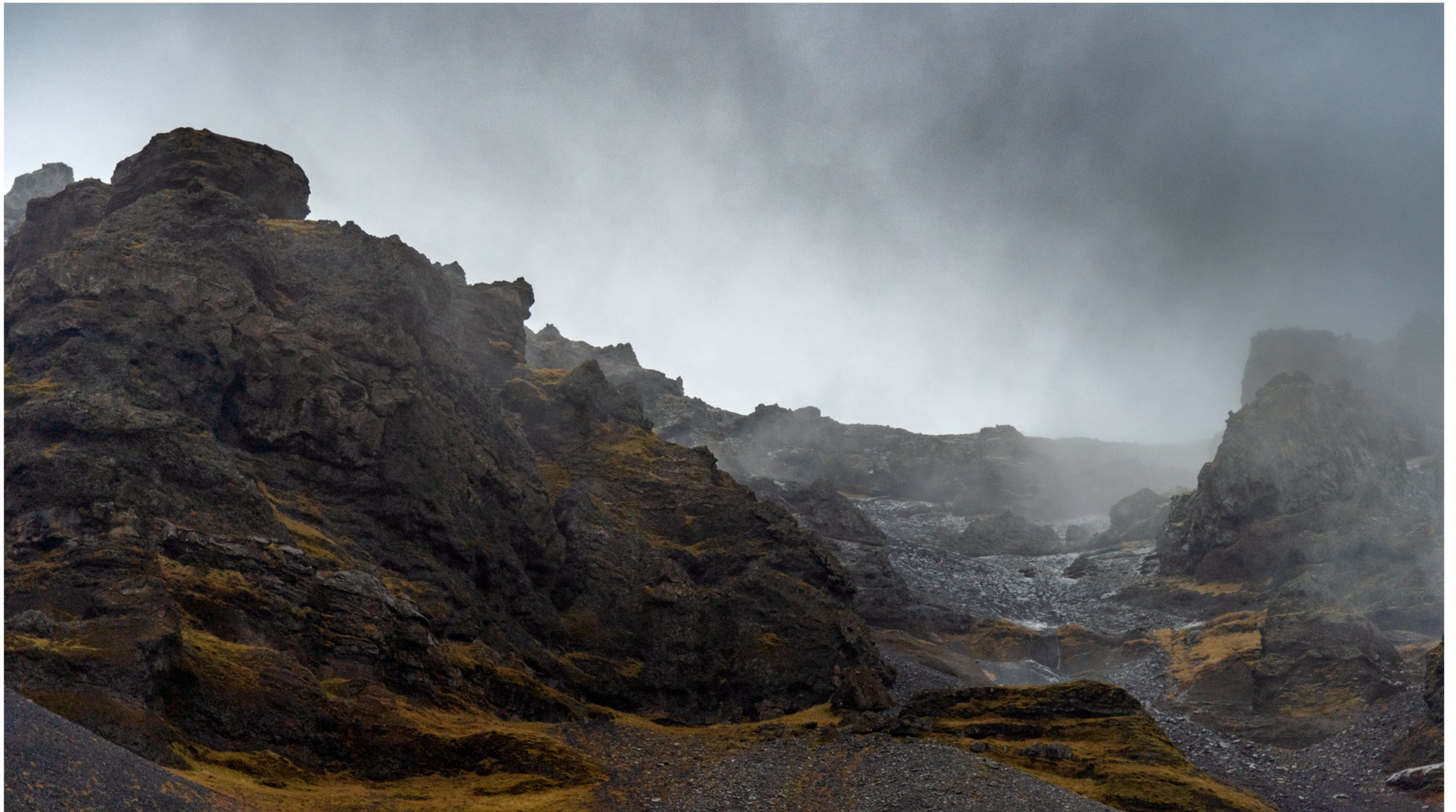
An der Südküste