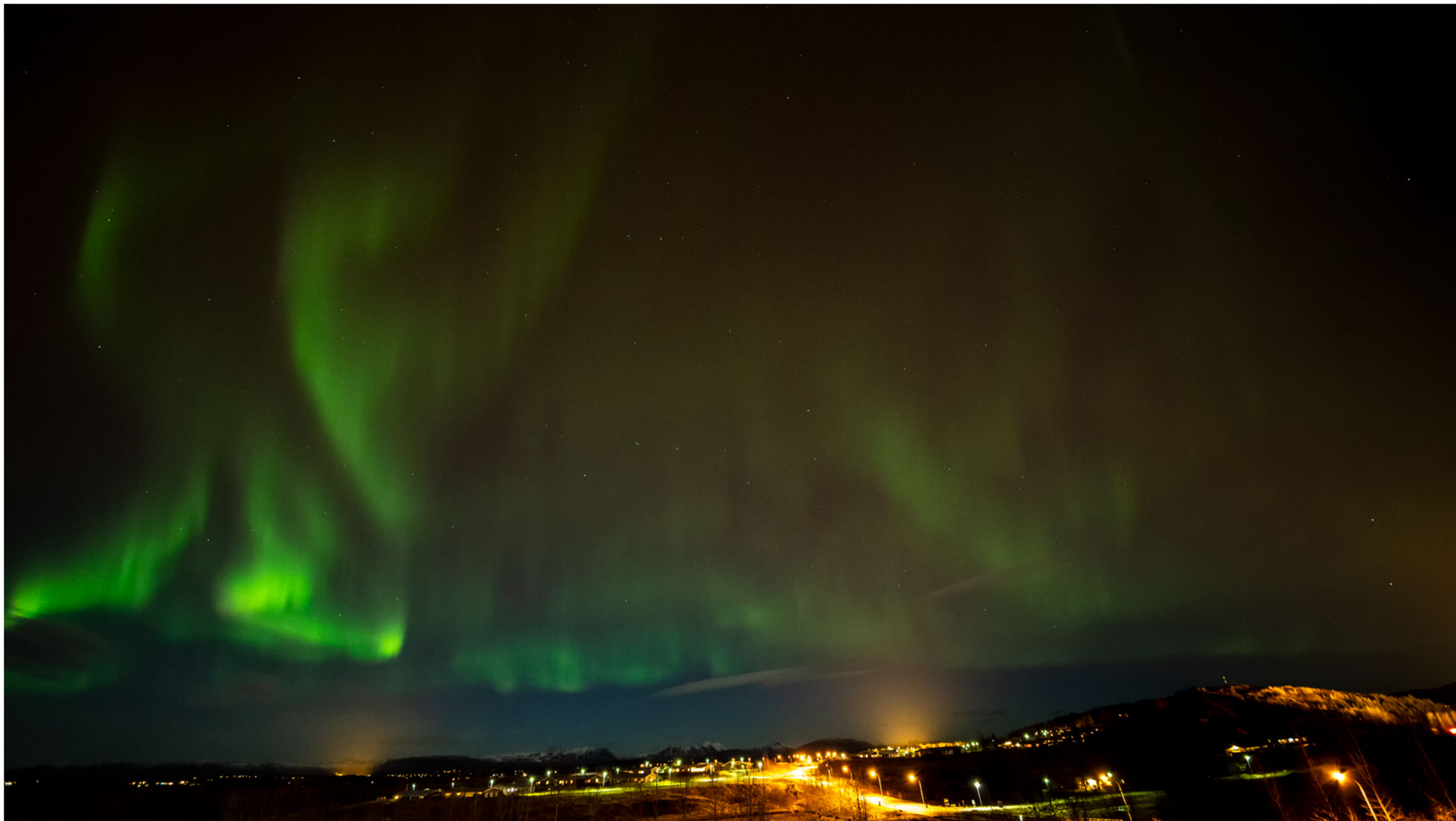
Aurora borealis in Fluðir