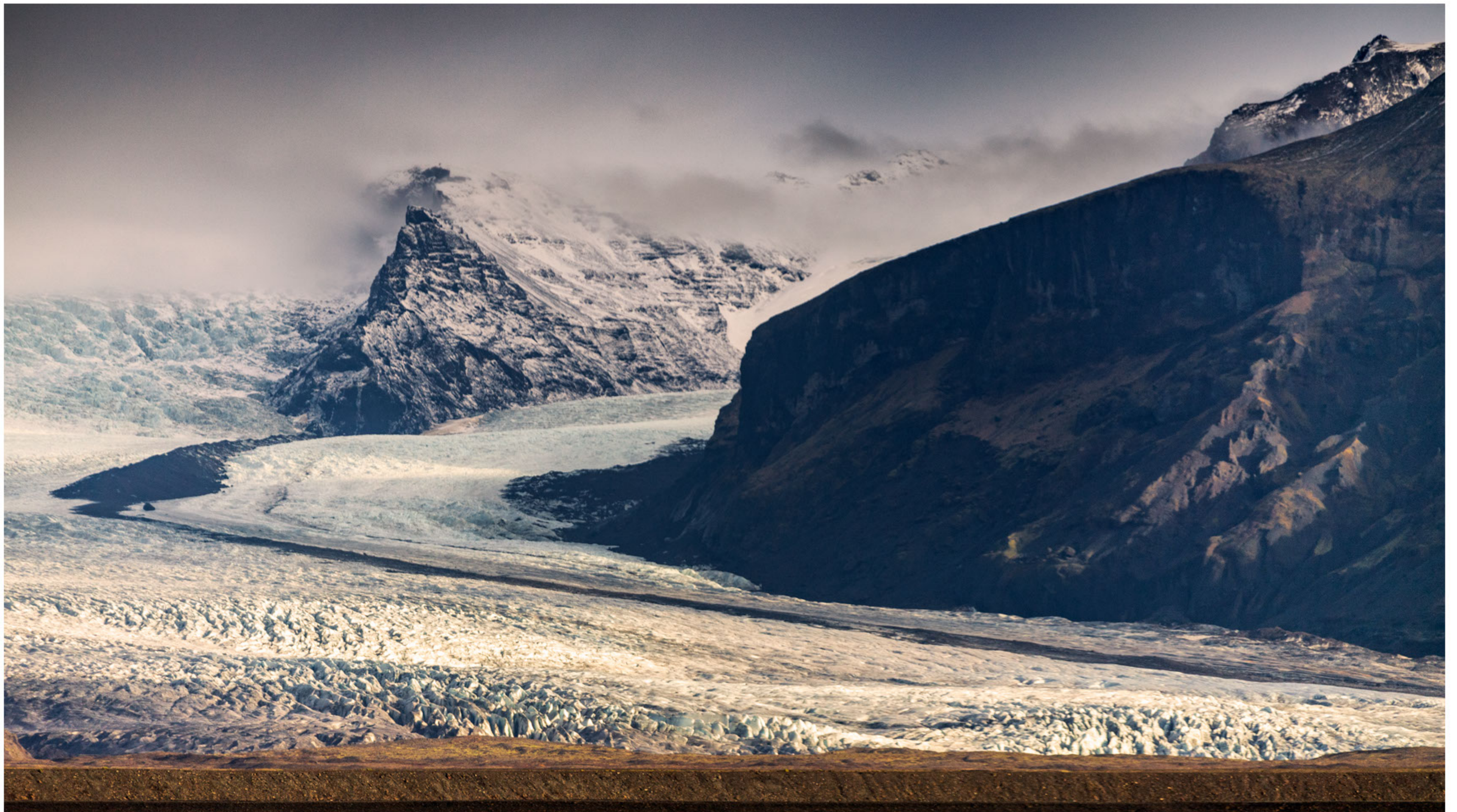
Die Gletscherzunge des Skaftafellsjökull