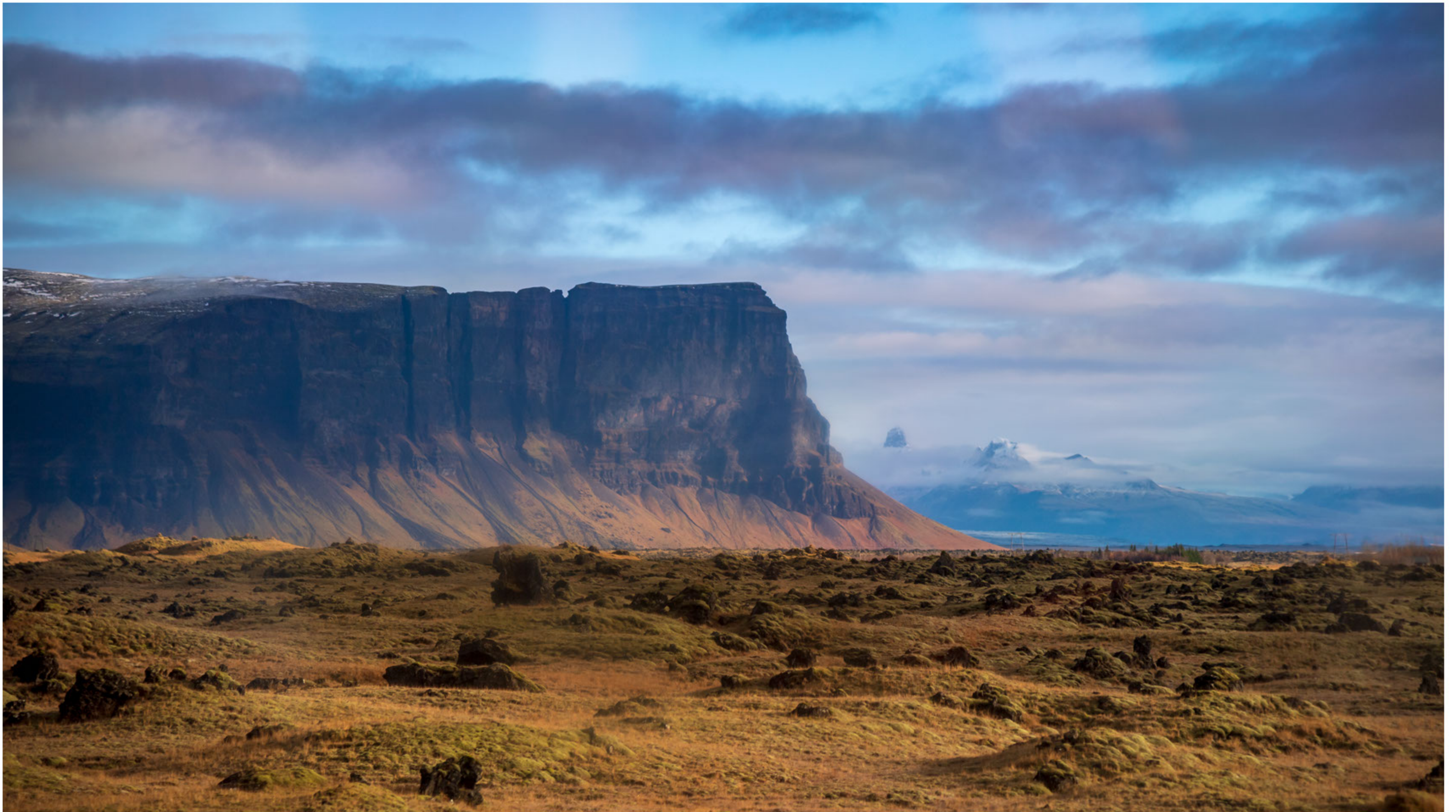
Blick auf die Ausläufer des Vatnajökull