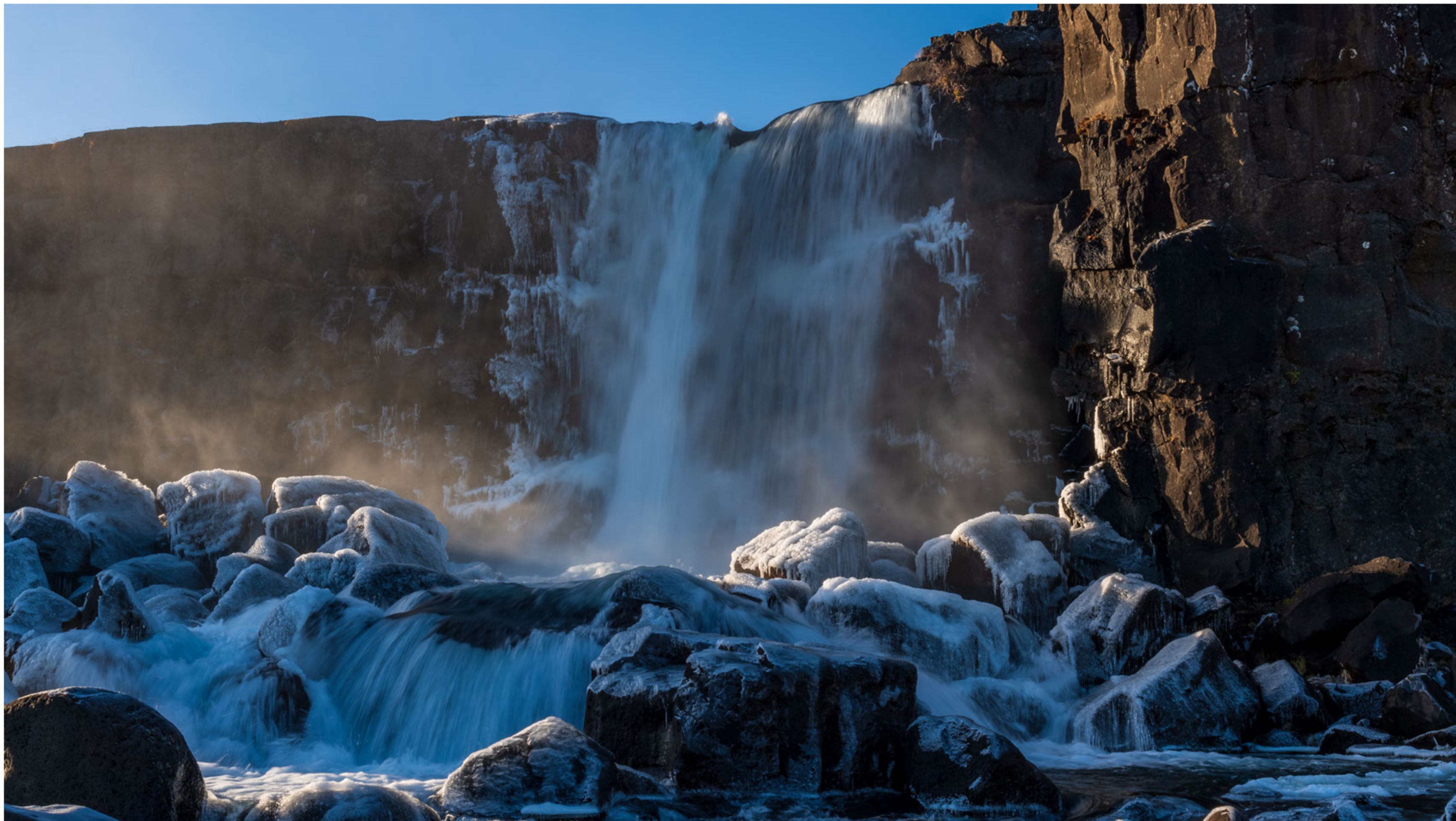
Die Öxára in Þingvellir