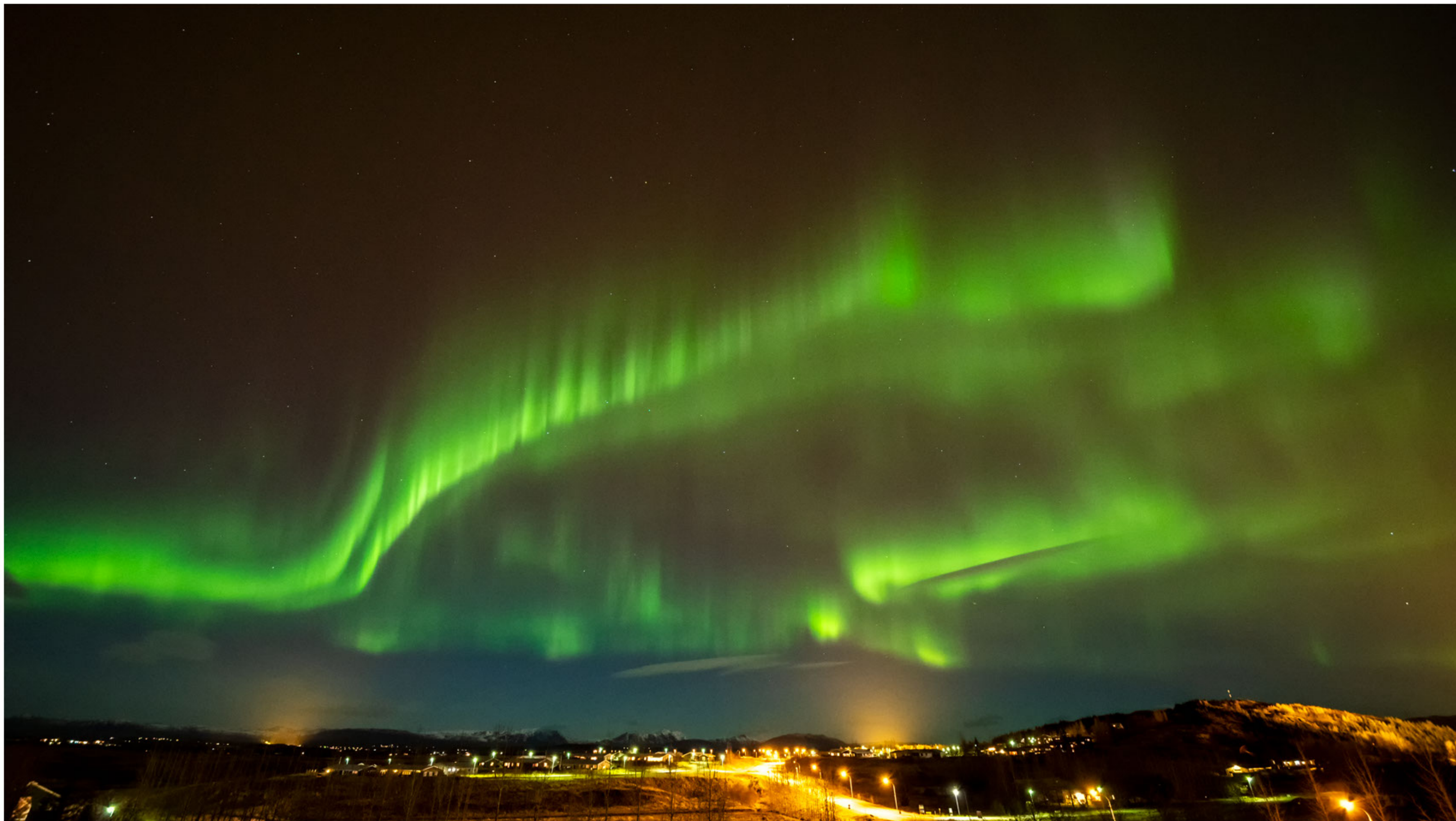
Aurora borealis in Fluðir