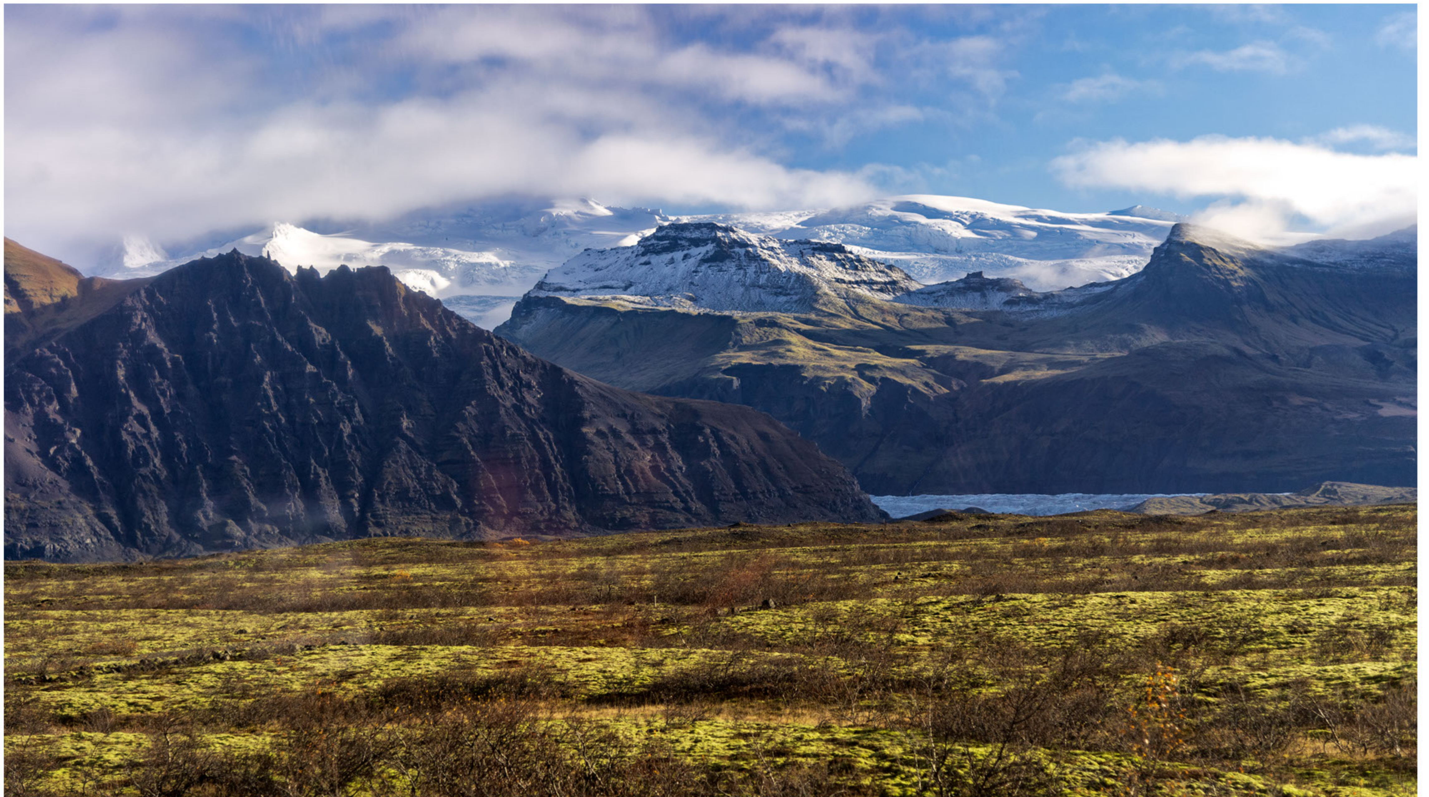
Der Skaftafellsjökull ist ein Talgletscher des Vatnajökull