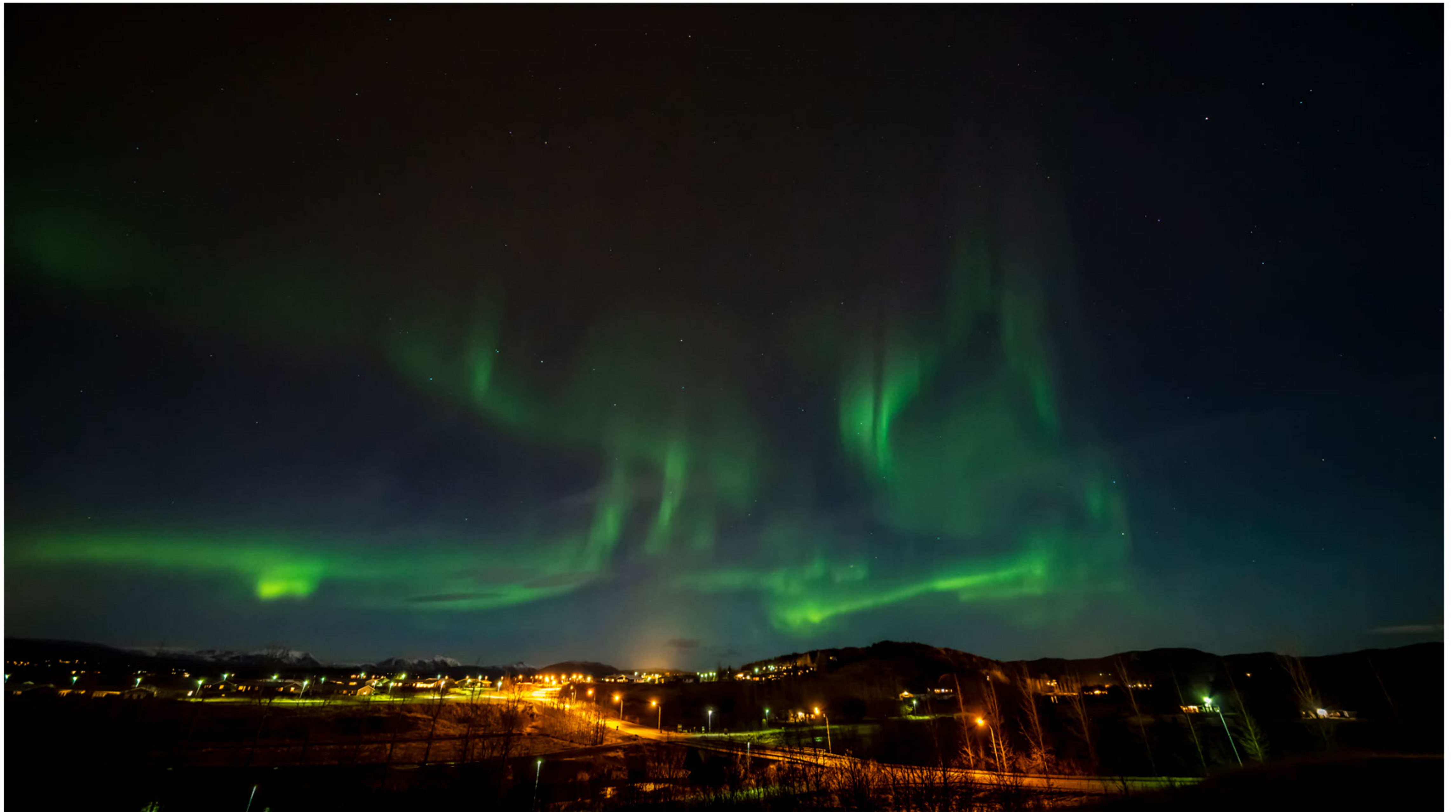
Aurora borealis in Fluðir