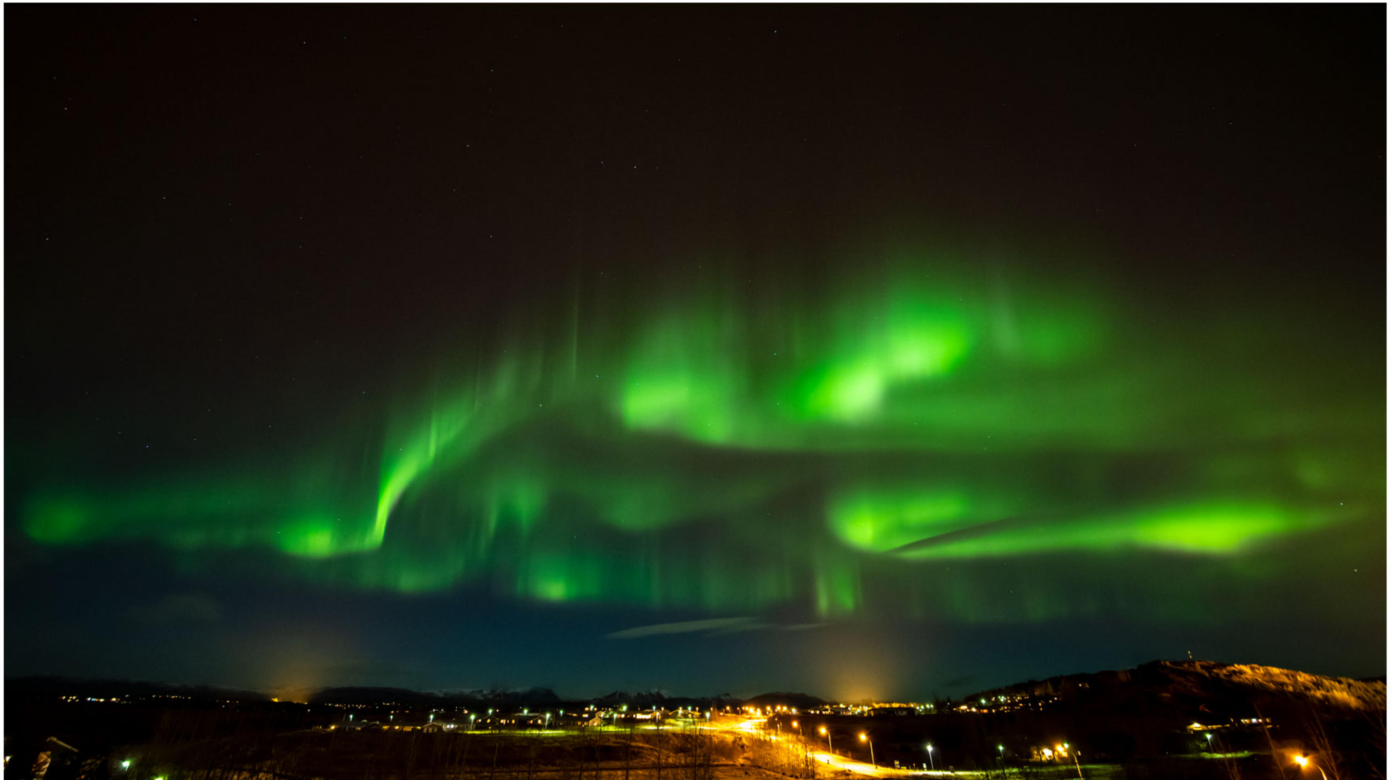
Aurora borealis in Fluðir