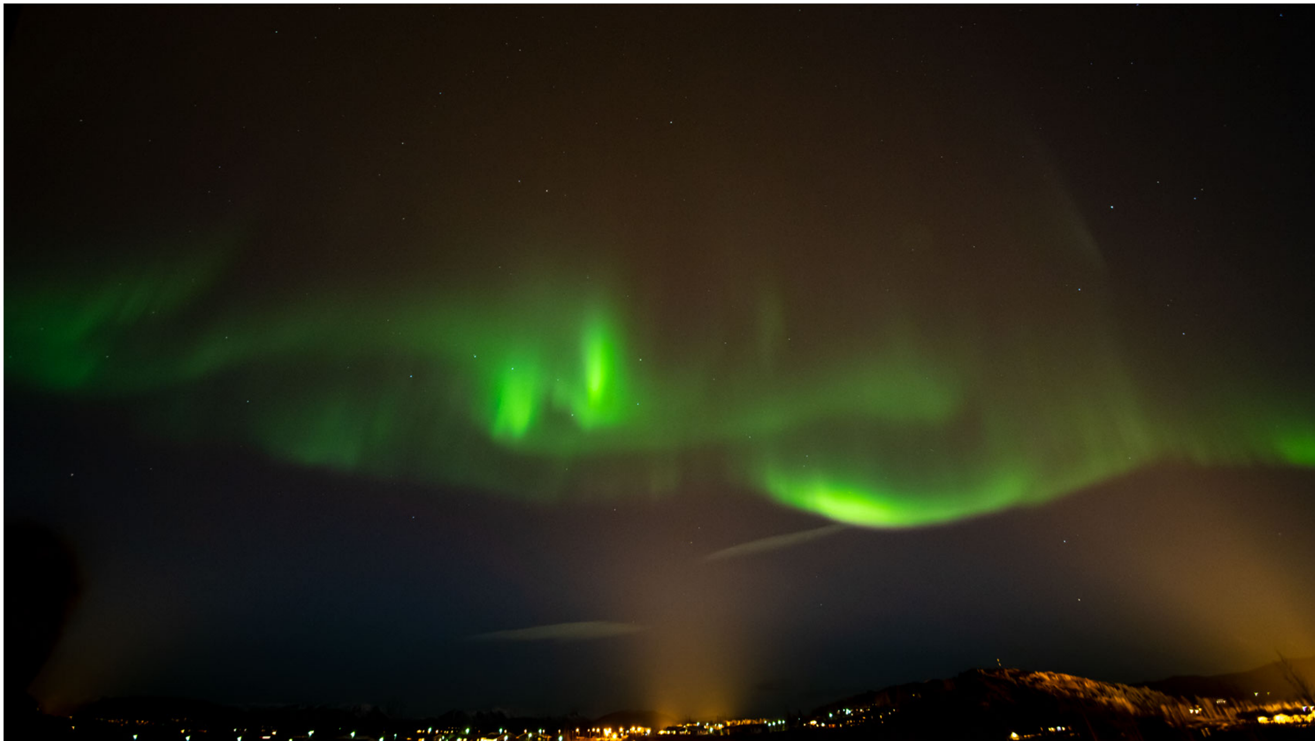
Aurora borealis in Fluðir