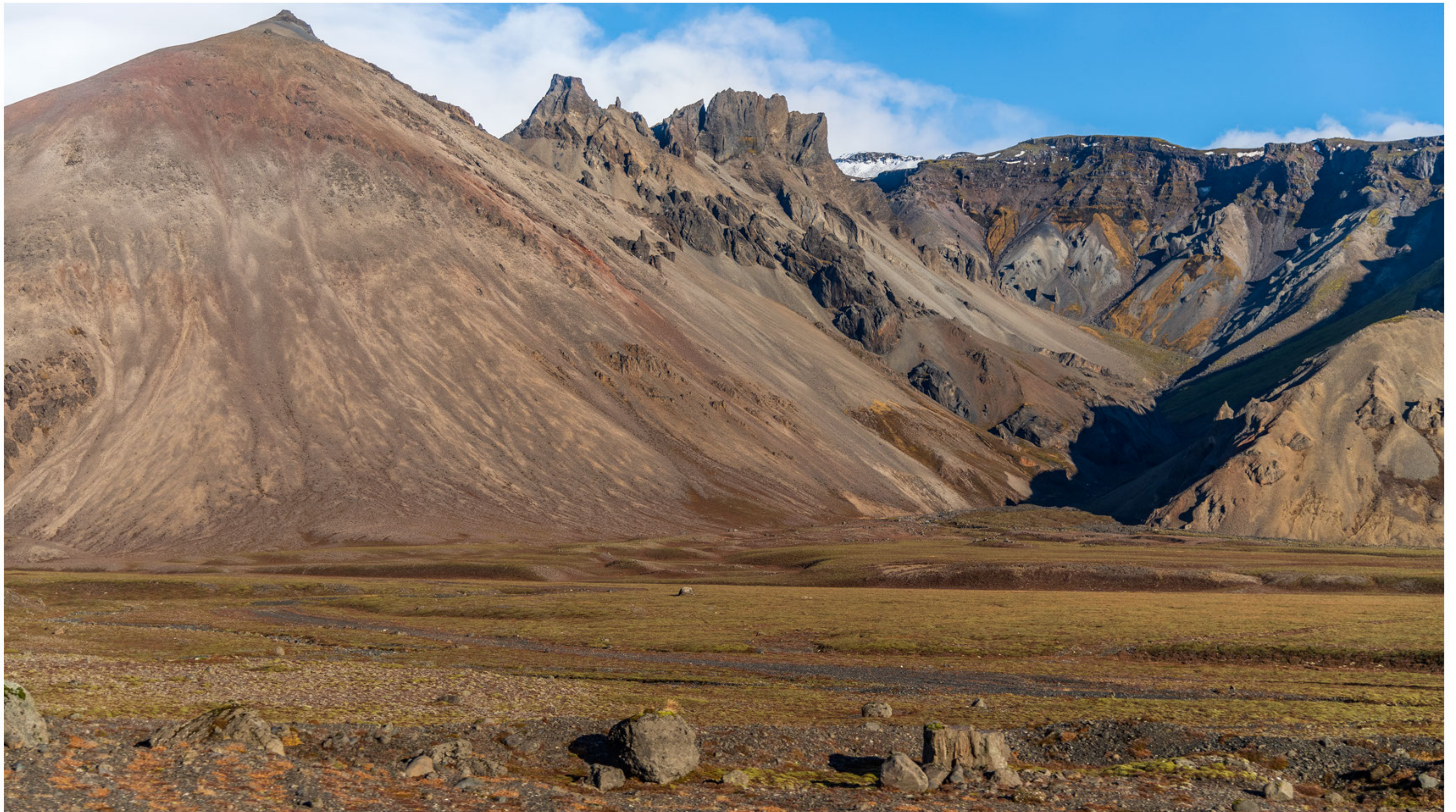
Am Weg zum Jökulsarlón