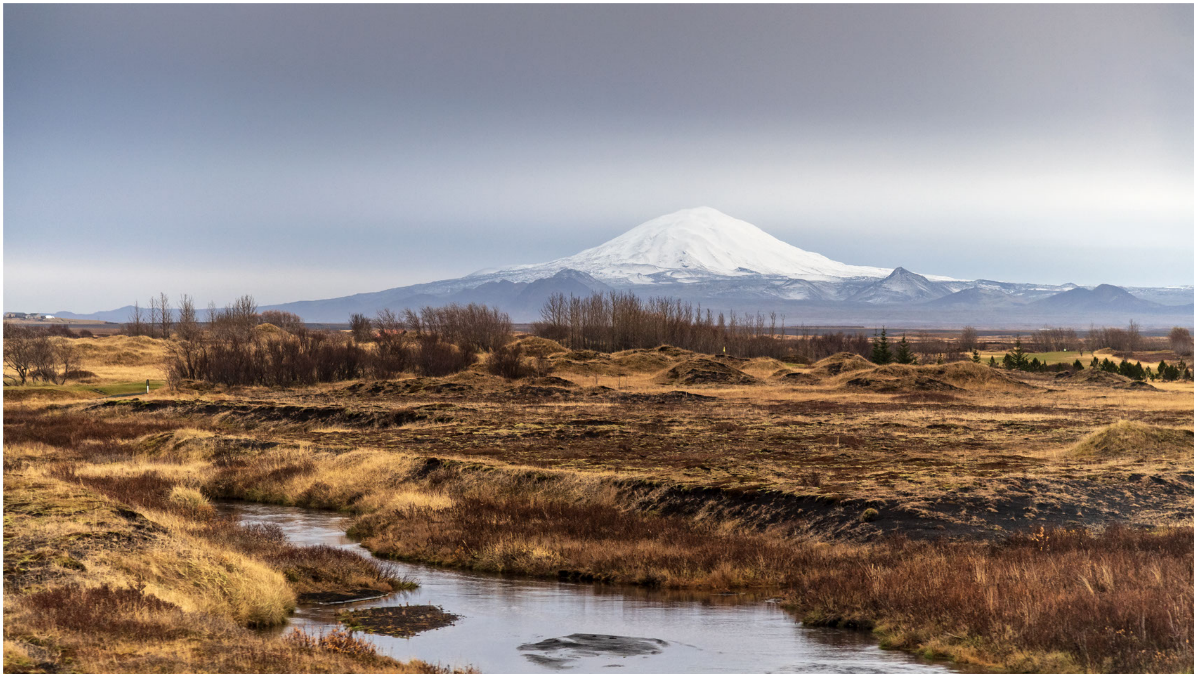
Der Vulkan „Hekla“