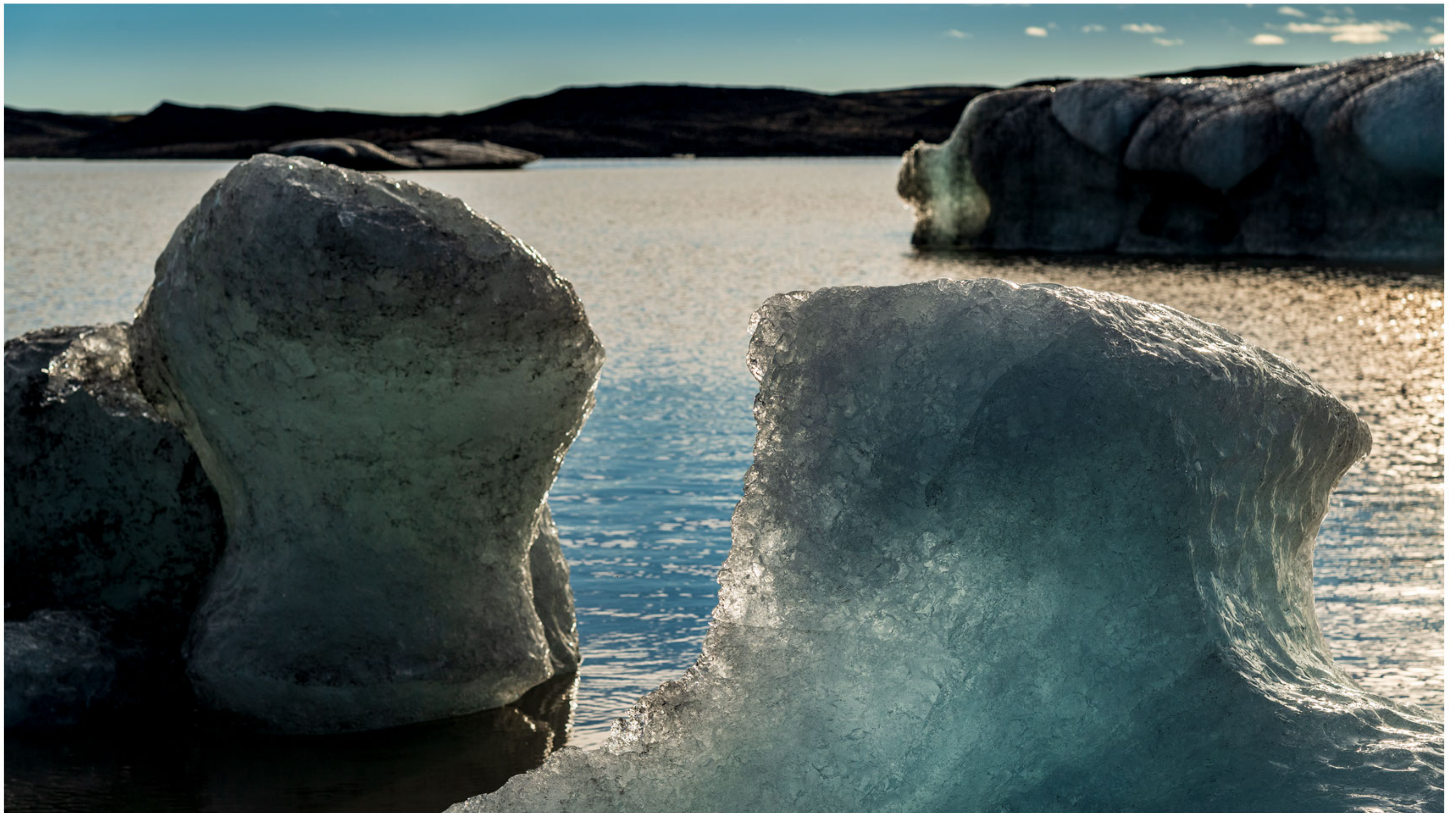
Gletscherlagune des Skaftafellsjökull