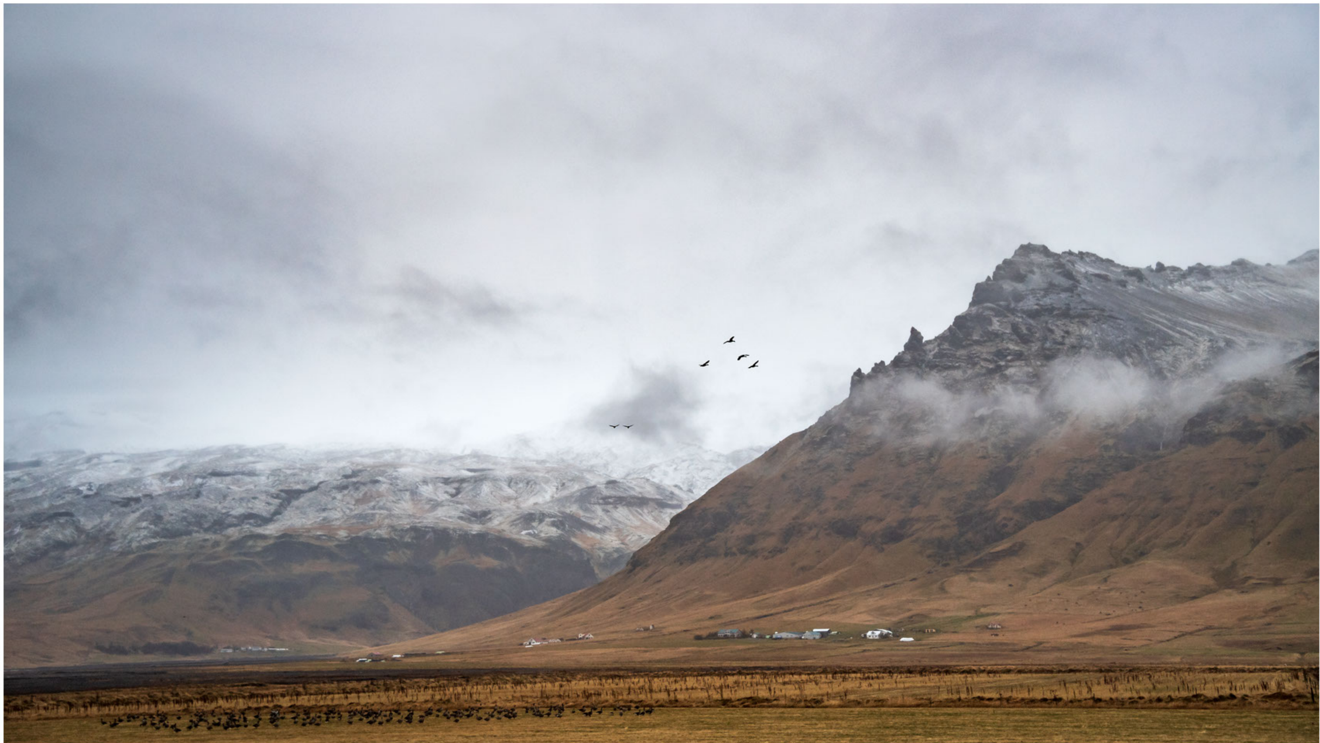
An den Abhängen des Eyjafjallajökull